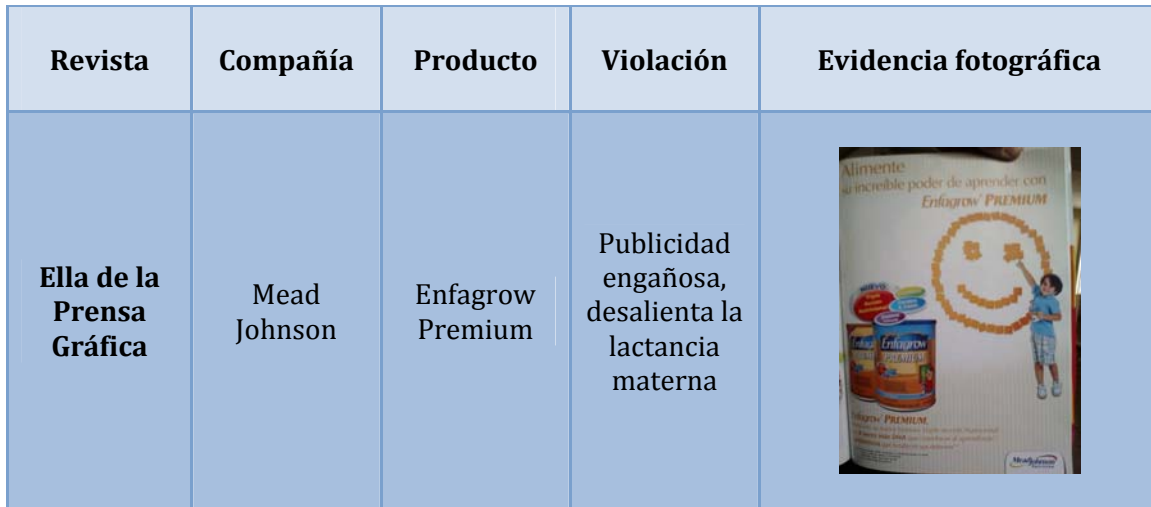
Cuadro N° 3. Publicidad en Revista Ella de la Prensa Gráfica

infantiles, las cuales desalientan la lactancia materna al mostrar propiedades extra que incluyen el consumo de estos productos. Lo anterior, viola en Código en lo dispuesto en el artículo 5.1 donde se determina que “No deben ser objeto de publicidad ni de ninguna otra forma de promoción destinada al público en general los productos comprendidos en las disposiciones del presente Código” . A continuación se muestra la violación.