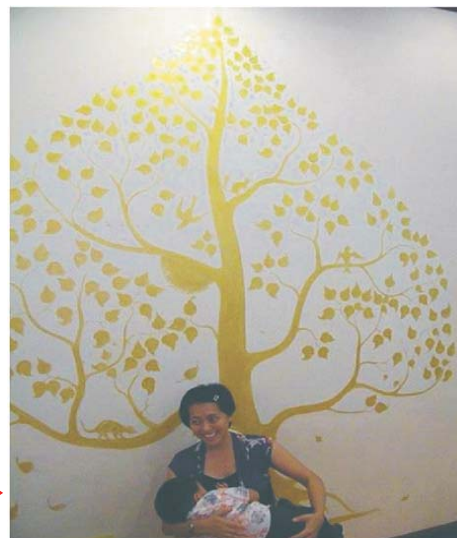
Foto: Sra. Jenny Ong, Filipinas (cortesía de Sra. Vaniavan Fernandes)

Preparado en casa: preparan alimentos autóctonos -después del tifón de Filipinas- con productos de las zonas no afectadas por el desastre.