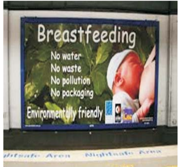
Soluciones Maternas- ¡más limpias y más verdes!