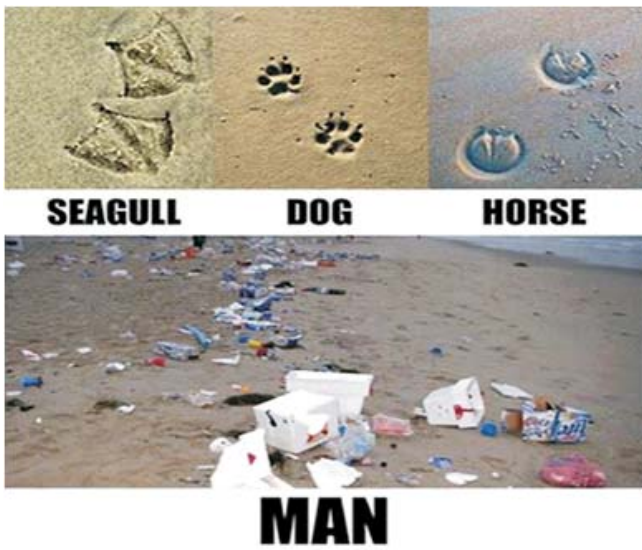
Soluciones Industriales- ¿limpias, verdes?