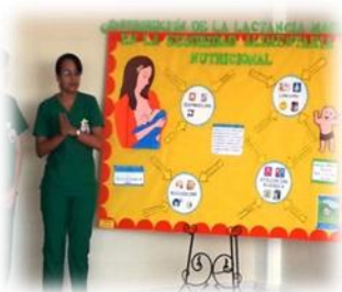
Técnicas para la lactancia materna