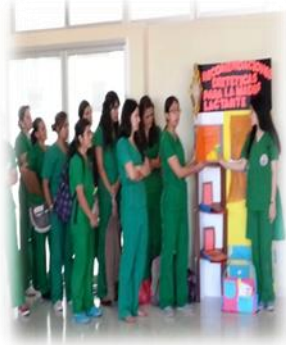
Contribución de la lactancia materna en la seguridad alimentaria nutricional (3er Lugar)