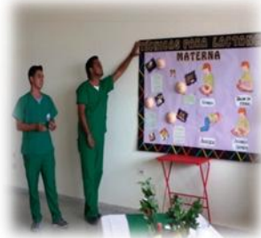
Lactancia materna y su contribución a la seguridad alimentaria nutricional