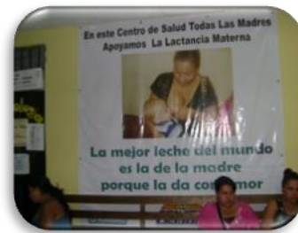
Mural Centro de Salud Pedregal