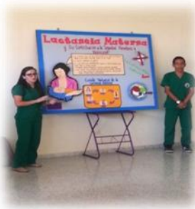
Ventajas de la Lactancia Materna