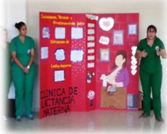
Indicaciones, técnicas y almacenamiento para extracción de leche materna (4to Lugar)