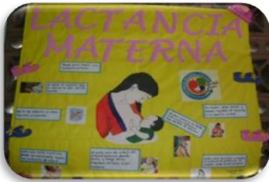
Mural Centro de Salud Alonso Suazo,