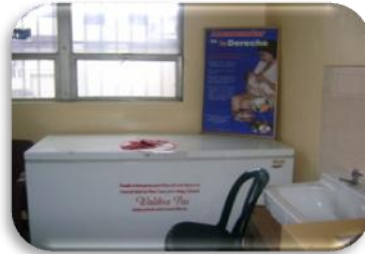
almacenamiento leche Humana.